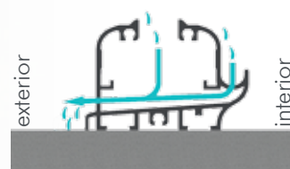
Ranuras de desagüe para expulsar al exterior el agua de la condensación y de la limpieza.

Sistema panorámico corredero-batiente serie 25 de todo cristal. El sistema más sencillo y elegante. Gracias a la ausencia de perfiles verticales y su transparencia total permite la integración en cualquier arquitectura. Los sistemas serie 30 y 35, familia directa de serie 25, se diferencian en que la unión de los paneles mediante perfilaría vertical de aluminio y juntas de goma, ofrece proporcional a estos sistemas una excelente hermeticidad. Cuando están cerrados, protegen contra las inclemencias del tiempo; cuando están abiertos dan paso a la totalidad de la superficie del hueco. Sistema serie 35 con vidrio ofrece, gracias del vidrio de cámara de 18 mm grosor, (de fábrica 4/10/4), una adicional protección térmica.