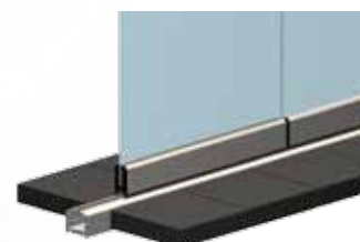
Opción de guía inferior para empotrar en el pavimento