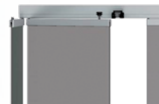
Las cristales apilan en un lateral ocupando un mínimo espacio